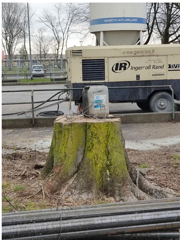
SITUAZIONE AD OGGI 25.02.2024